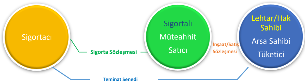
Şekil 1: BTS'nin kurgusal yapısı

BTS sözleşmesinin tarafları her ne kadar müteahhit/satıcı ile sigorta şirketi ise de, BTS'nin kefalet sigortası ürünü olması nedeniyle BTS poliçesine bağlı olarak üretilen teminat senetleri aracılığıyla hak sahipleri adına koruma sağlayan bir sigorta ürünüdür. BTS'nin kurgusal yapısına ilişkin işleyişe Şekil 1 'de yer verilmiştir.